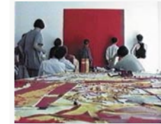
Zwischen 570 und 700 nm