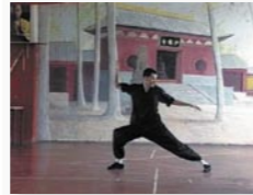
Kung Fu Präsentationen