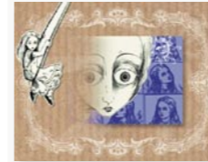
Alice im Wunderland der Medien

Die Allgegenwart technischer Bilder, der wir uns offenbar selbst im Traum nicht entziehen können, wird mit dem Verweis auf das Computernetzwerk, den Browser, noch einmal pointiert. Virtual Reality als Traumereignis und umgekehrt. Die Autorin schließt den Kreis zwischen der mediatisierten Welt und der Welt der Traumbilder. Sie verweist auf den Einfluss, den die technischen Bildmedien zweifellos auf unsere Träume ausüben.