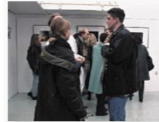
Grains & Pixels