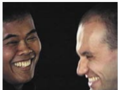
Kung Fu Dialog